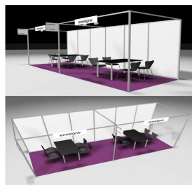
展台图片仅供参考,以实物为准。