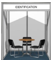
展台图片仅供参考,以实物为准。