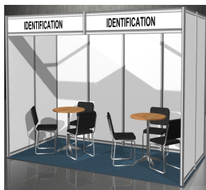
展台图片仅供参考,以实物为准。